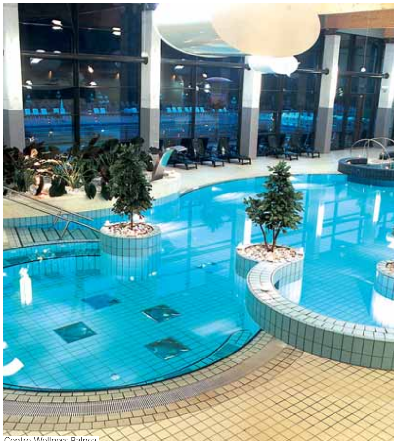
Centro Wellness Balnea