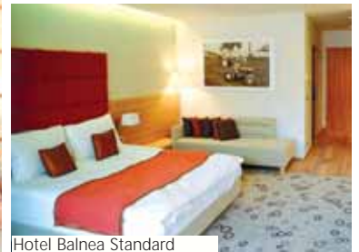
Hotel Balnea Standard