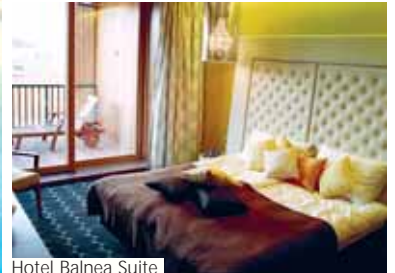
Hotel Balnea Suite