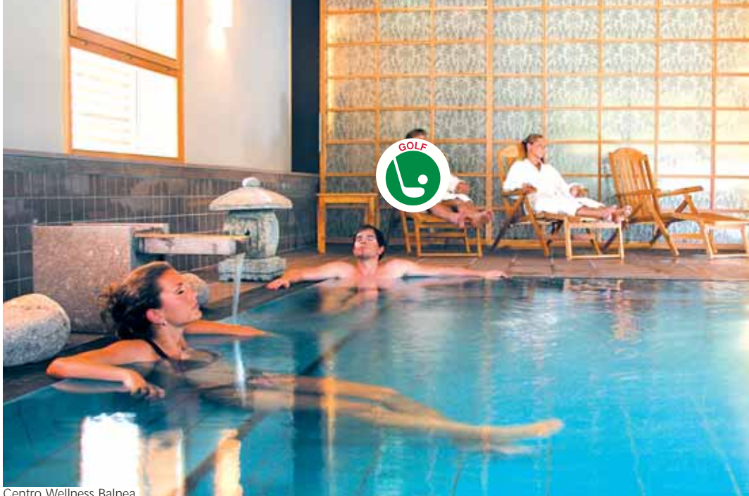
Centro Wellness Balnea