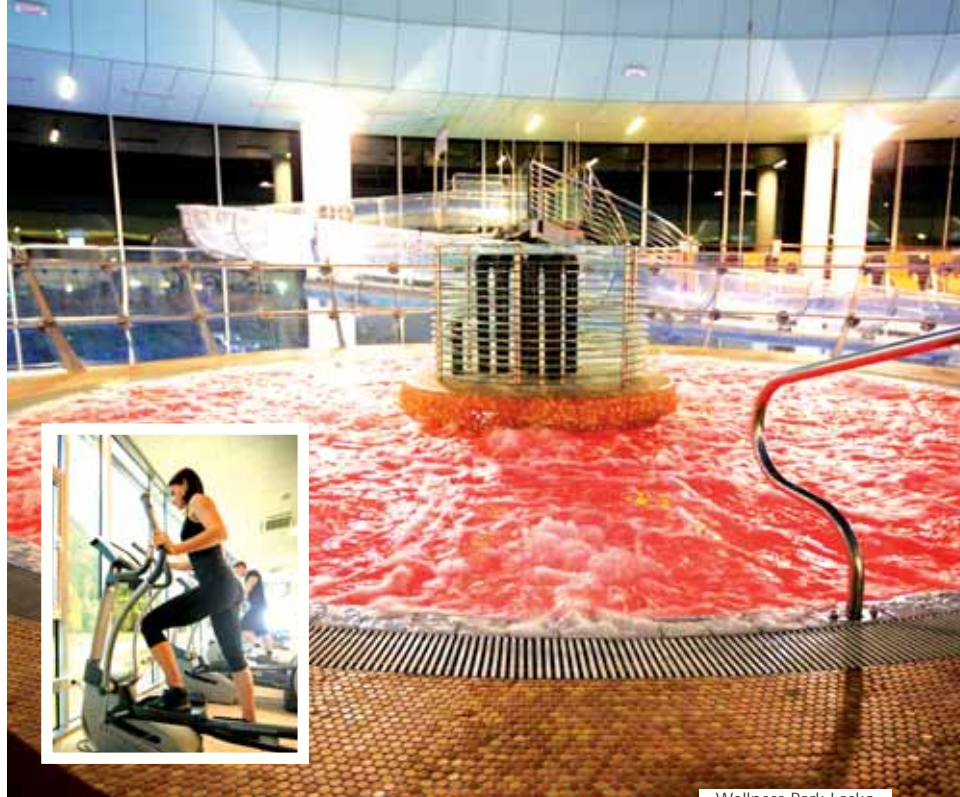
Wellness Park Lasko