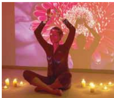
Wellness Park Camera Standard