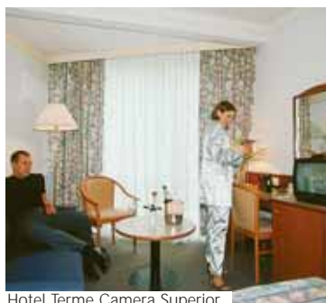
Hotel Terme Camera Superior

Servizi a pagamento Centro Medico-Diagnostico con chiroterapia, reumatologia, cura dei disturbi dell'apparato osteoarticolare e delle malattie della pelle; Centro Benessere e Bellezza con massoterapia in genere, massaggi ayurvedici, balneoterapia, cosmesi. Centro Benessere "Wellness Park" di 900 mq con 25 cabine per i trattamenti. Transfer per taxi per tratta (max 4 persone), prezzi indicativi: stazione ferroviaria o aeroporto di Trieste € 115., stazione ferroviaria o autobus di Celje € 8., stazione ferroviaria o autobus di Lubiana o Maribor € 55., stazione ferroviaria o autobus di Graz o Klagenfurt € 75.. Inoltre 3 ristoranti: il "Vrelec", il salone "Banquet" e il salone "Biedermaier"; 2 caffè, terrazza solarium, sale congressi, programmi ricreativi e rilassanti, animazione. Nuovo ristorante e bar nel centro "Wellness Park". Casino a Rogaska a 40 Km. Golf a Slovenske Konjice 30 Km.