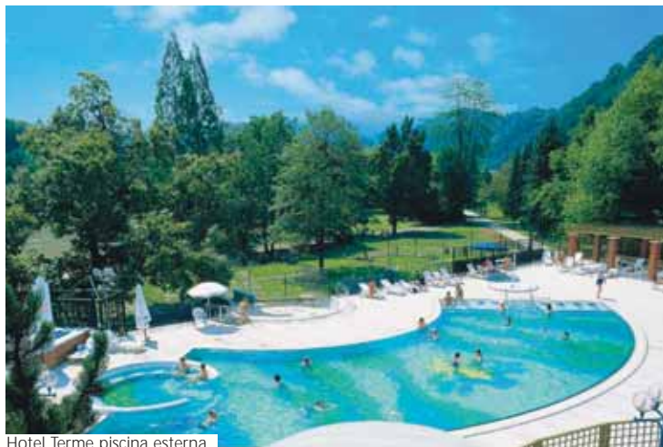
Hotel Terme piscina esterna