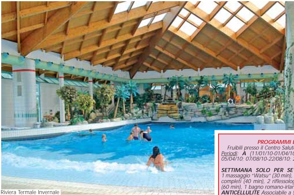
Riviera Termale Invernale