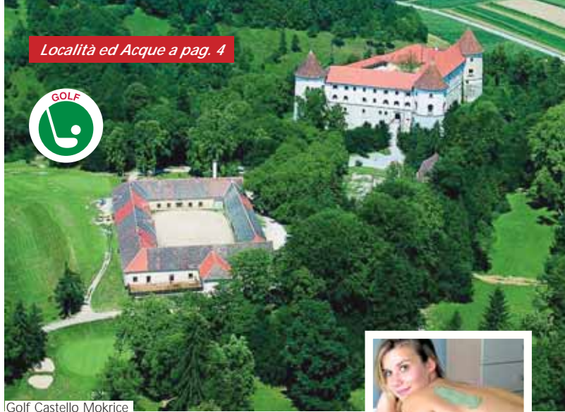
Golf Castello Mokrice