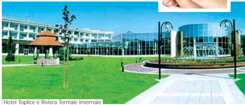
Hotel Toplice e Riviera Termale Invernale