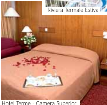
Hotel Terme - Camera Superior