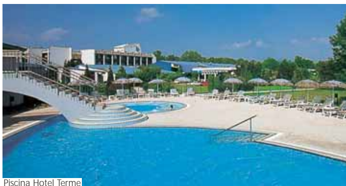
Piscina Hotel Terme