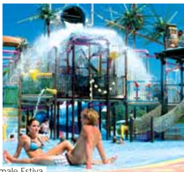
Riviera Termale Estiva