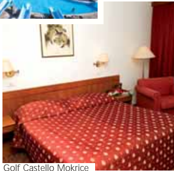
Golf Castello Mokrice