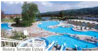
Riviera Termale Estiva