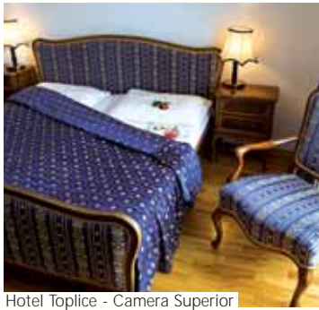
Hotel Toplice - Camera Superior