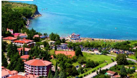
Località a pag. 6