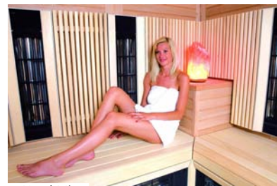
Centro Benessere Hotel Mirta