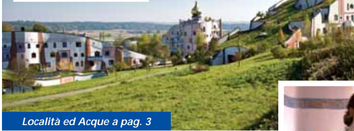
Località ed Acque a pag. 3