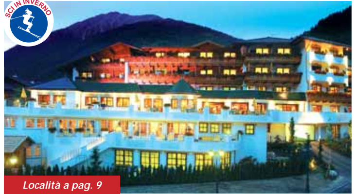
Località a pag. 9

E' situato nel paesino di Valles, in Val Pusteria, lato sud delle Alpi Aurine, a circa 1350 metri di altitudine. Il paesaggio è magnifico e la visione dei pascoli e delle montagne ci comunica veramente un grande senso di pace. L'aria fresca ed il profumo dei boschi ci accompagnano fino all'Hotel, che ci accoglie col suo calore e le sue piacevolissime atmosfere. Completamente rinnovato ed ingrandito, offre tradizione, eleganza e funzionalità: bellissime camere, lussuosi ambienti comuni che ci comunicano vivacità ed allegria, una caratteristica Stube, bar, soleggiate terrazze e quale fiore all'occhiello della Casa un Reparto Benessere fra i più belli e funzionali di questa programmazione. Anche i bambini sono benvenuti e per loro esiste assistenza per bambini da 4 a 10 anni (solo nei periodi di vacanze), buffet dedicato alla sera, menù speciali, assistenza durante la cena. Estate ed inverno offrono poi infinite possibilità di godere una natura incontaminata attraverso la pratica di sport o semplicemente attraverso passeggiate ed escursioni, anche guidate.