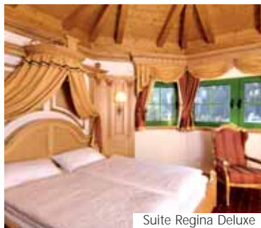
Suite Regina Deluxe