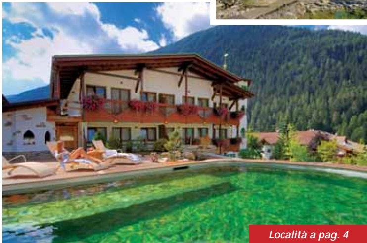
Località a pag. 4