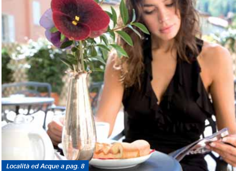
Località ed Acque a pag. 8