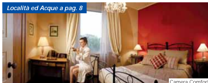
Località ed Acque a pag. 8