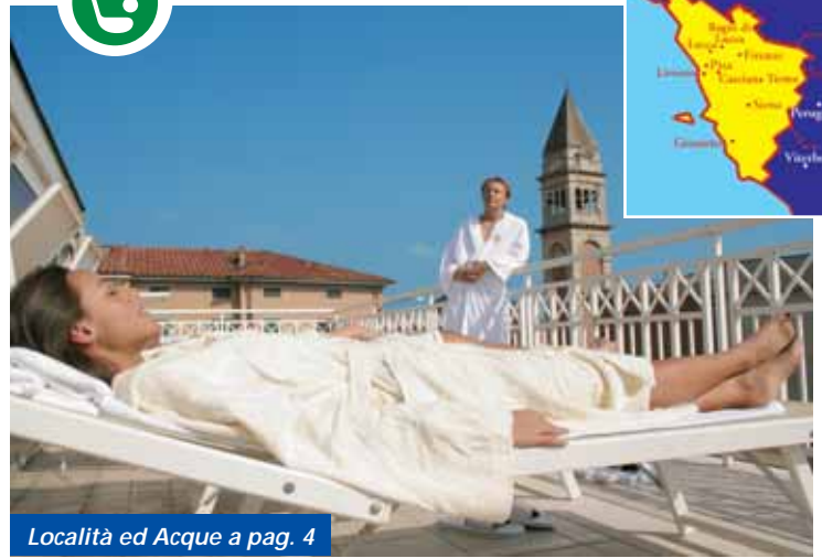
Località ed Acque a pag. 4