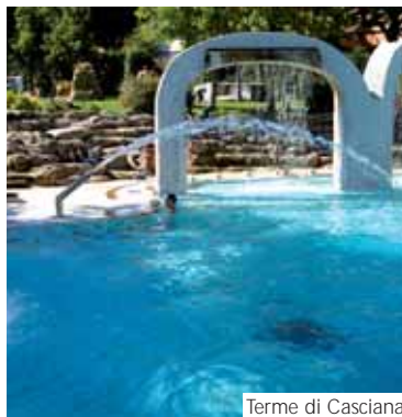
Terme di Casciana