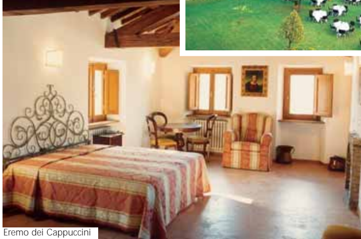
Eremo dei Cappuccini