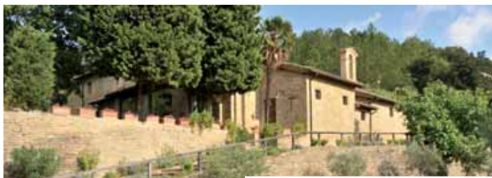
Eremo dei Cappuccini