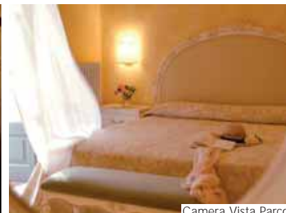
Camera Vista Parco